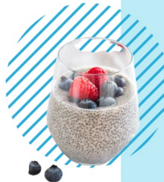
CHIA COCO ET COULIS FRUITS ROUGES