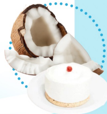
BLANC MANGER COCO