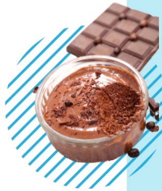
MOUSSE AU CHOCOLAT